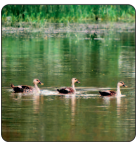
मार्स हैरियर, स्पॉटेड इंगल, गीनीस वागलर पक्षी, बुटेड वागलर पक्षी, फ्लाई कैचर, रेड बेस्टेड प्रमुख प्रवासी पक्षी हैं, जो छत्तीसगढ़ के जंगलों, आर्द भूभागों व प्रवासी क्षेत्रों में प्रवास करते हैं।