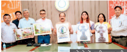
लोगों में छत्तीसगढ़ की सांस्कृतिक पहचान

चीफ मिनिस्टर छत्तीसगढ़ ट्रॉफी में दिग्गज खिलाड़ी बिखेरेंगे अपनी चालों का जादू