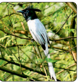
मार्स हैरियर, स्पॉटेड इंगल, गीनीस वागलर पक्षी, बुटेड वागलर पक्षी, फ्लाई कैचर, रेड बेस्टेड प्रमुख प्रवासी पक्षी हैं, जो छत्तीसगढ़ के जंगलों, आर्द भूभागों व प्रवासी क्षेत्रों में प्रवास करते हैं।

के वेटलैंड, जंगलों और रहवासी क्षेत्रों में 520 प्रजाति के पक्षियों ने अपना डेरा जमाया हुआ है। इसमें 70 से 80 प्रकार के प्रवासी पक्षी और बाकी 450 के आसपास स्थानीय व अप्रवासी पक्षियां शामिल हैं। राज्य के प्रमुख जलीय क्षेत्र, पक्षी विहार और वनक्षेत्रों