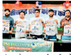
संगठन के अनुसार, डील की शर्तें किसान हितों को कमजोर करने वाली हैं। इससे कृषि बाजार पर बाहरी प्रभाव बढ़ेगा। अमेरिकी कारपोरेट्स की एंट्री से छोटे उद्योग बंद होने की आशंका है। रणनीतिक कंपनियों का डेटा अमेरिका को दिए जाने की चर्चा भी बेहद चिंताजनक है। एपस्टीन फाइंडिंग के बाद प्रधानमंत्री पर बाहरी आशंकाओं के सवाल भी चिंतनीय हैं।

अमेरिका के साथ ट्रेड डील के विरोध में यूथ कांग्रेस 16 मार्च को दिल्ली में संसद का घेराव करेगी। इस घेराव में छत्तीसगढ़ यूथ कांग्रेस के पदाधिकारी और कार्यकर्ता भी शामिल होंगे। शुक्रवार को रायपुर में हुई प्रेस वार्ता में भारतीय युवा कांग्रेस ने केंद्र सरकार की प्रस्तावित अमेरिका-भारत ट्रेड डील को किसानों, युवाओं और राष्ट्रीय सुरक्षा के लिए खतरनाक बताते हुए तीखा विरोध दर्ज किया। संगठन ने इस डील को "भारतहित के खिलाफ और भविष्य पर सीधा आघात" बताया। यूथ कांग्रेस ने ट्रेड डील के कई बिंदुओं पर आपत्ति जताई है।