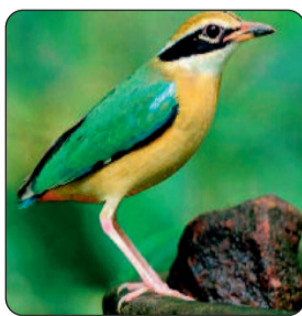
इन प्रवासी पक्षियों से गुलजार वादियां : कॉमन पोचर्ड, रेड हेडेड पोचर्ड, पीनटेल, गेडवाल, गीन सैंड पाइपर, वुड सैंड पाइपर, वेगटल पक्षी, कॉमन केन, ब्लैक स्टॉर्क,